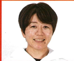
アテネオリンピック 女子マラソン 金メダリスト 野口 みずきさん