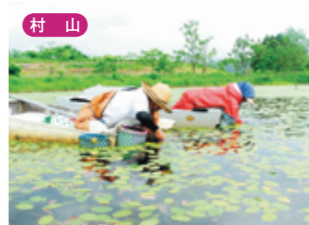
村山 天然ジュンサイ摘み採り体験 [6月上旬~7月下旬]