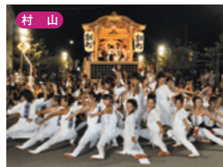
村山 むらやま徳内まつり [8月下旬]