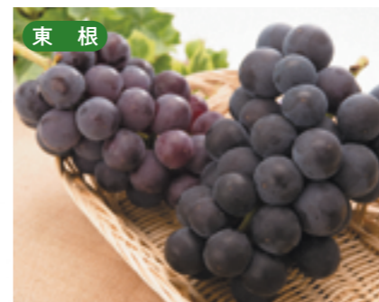
東根 ぶどう [9月上旬~10月上旬]