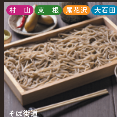
村山 東根 尾花沢 大石田 そば街道