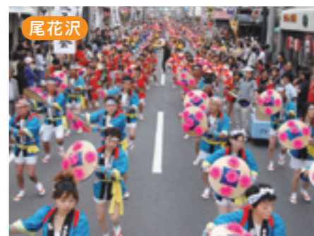
尾花沢 おばなざわ花笠まつり [8月27・28日]