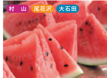
村山 尾花沢 大石田 スイカ [7月下旬~8月]