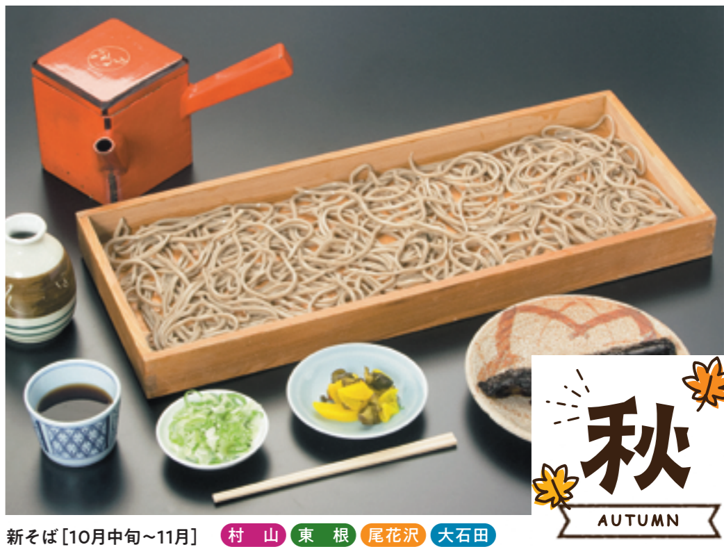
新そば [10月中旬~11月] 村山 東根 尾花沢 大石田