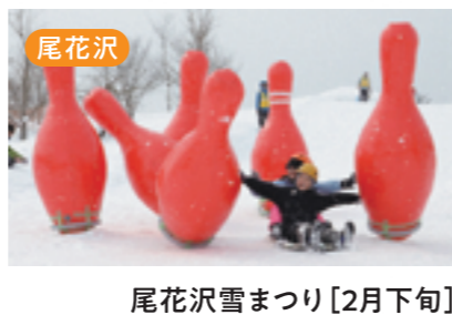
尾花沢 尾花沢雪まつり [2月下旬]