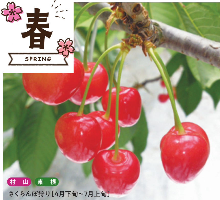
村山 東根 さくらんぼ狩り [4月下旬~7月上旬]