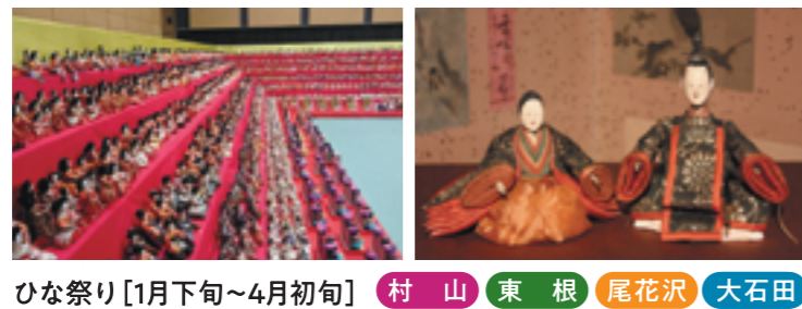
ひな祭り [1月下旬~4月初旬] 村山 東根 尾花沢 大石田