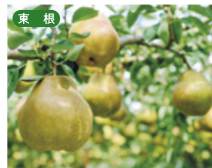
東根 ラ・フランス [10月下旬~11月]