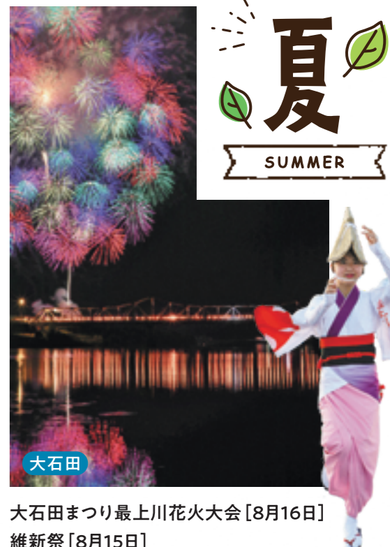
大石田 大石田まつり最上川花火大会 [8月16日] 維新祭 [8月15日]