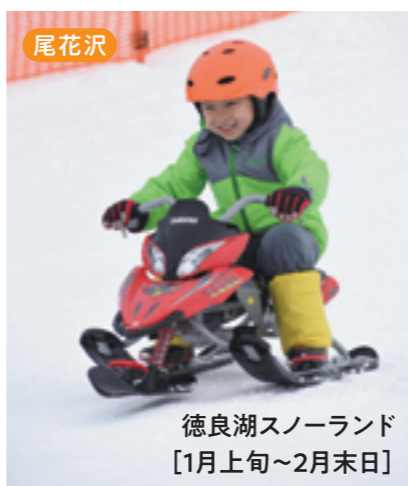
尾花沢 徳良湖スノーランド [1月上旬~2月末日]