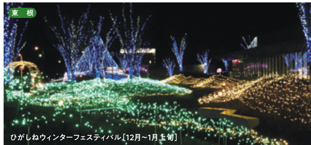
東根 ひがしねウィンターフェスティバル [12月~1月上旬]