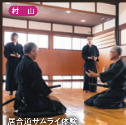
村山 居合道サムライ体験