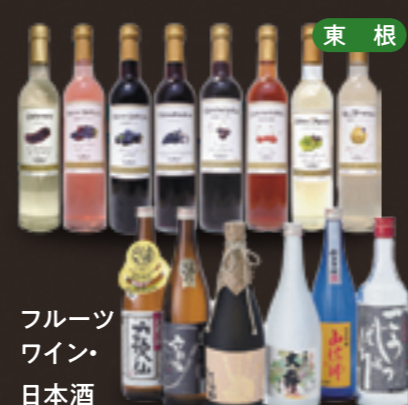
東根 フルーツワイン・日本酒