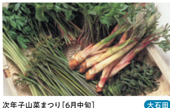
村山 バラまつり [6月上旬~下旬] 次年子山菜まつり [6月中旬] 大石田