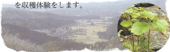
山菜アイコ(みやまいらくさ)

Bコース：山菜採り体験ツアー 自然を満喫しながら、山菜の王様「あいこ」 を収穫体験をします。