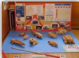
外来生物の釣り体験